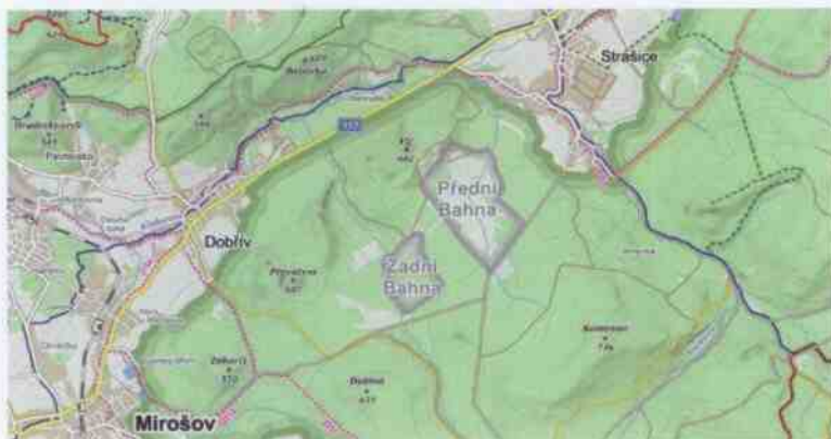
Obrázek 16: Turistické trasy vedoucí Dobřívem (objevbrdy.cz, 2019)

Dobřív má výhodu v tom, že se nachází v těsné blízkosti chráněné krajinné oblasti Brdy, kde se nachází mnoho turistických tras a okruhů, jak lze vidět i na následujícím obrázku. Dobřívem prochází dvě hlavní trasy vedoucí ze Štáhlav ( modrá ) a ze Svojkovic ( žlutá ). Obě trasy vedou do stejného místa v centru Brd, na rozcestí Tři Trubky, kde se dále napojují na další trasy vedoucí po Brdech.