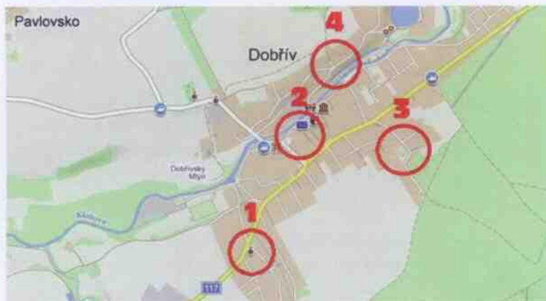
Obrázek 17: Rekreační zařízení v obci Dobřív (vlastní zpracování dle mapy.cz, 2019)

Ke sportovním výkonům patří i rekreace, přičemž Dobřív nabízí návštěvníkům obce 4 rekreační zařízení. Prvním je Campus Dobřív (1) sídlící v objektu bývalé fary, který má kapacitu 6 pokojů. Druhým je Restaurace a penzion Hamrovka (2), který se nachází poblíž budovy obecního úřadu a nabízí návštěvníkům čtyři pokoje a jeden apartmán. Třetím zařízením je turistická ubytovna TJ Sokol Dobřív (3), která byla zmíněna výše. Objekt ubytovny se nachází přímo u vstupu do CHKO Brdy a víceúčelového hřiště u Sokolovny a nabízí 10 pokojů a jeden apartmán. Posledním zařízením je Rodinný penzion Dobřív (4), který nabízí jeden apartmán a jeden pokoj pro 3 osoby. Všechna rekreační zařízení lze vidět na následujícím obrázku.