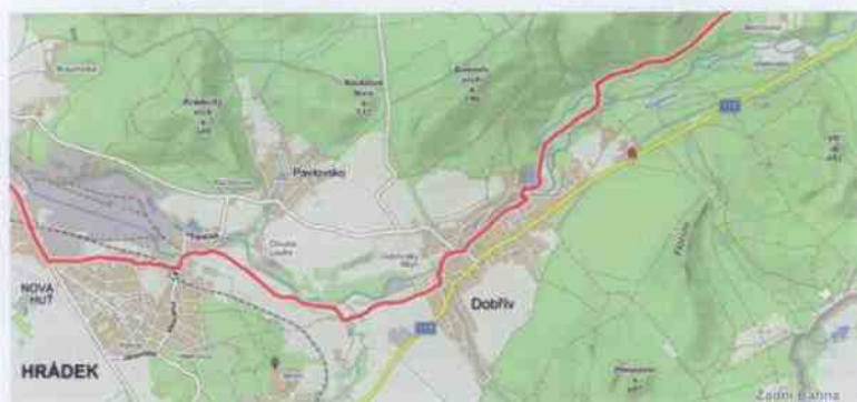
Obrázek 15: Cyklotrasa č. 3 – část cyklotrasy procházející Dobřívem (mapy.cz, 2019)

Dobřívem procházejí i další cyklotrasy s čísly: