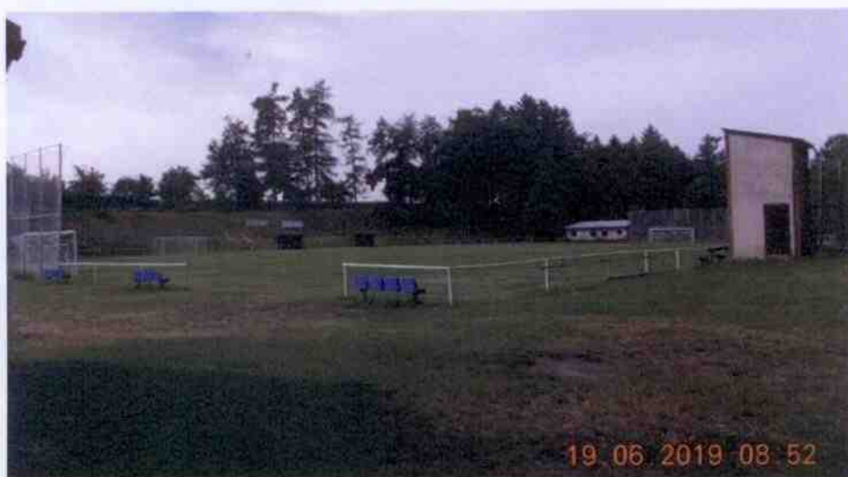
Obrázek 10: Fotografie fotbalového hřiště (Obec Dobřív, 2019)

Dalším sportovním zařízením v majetku obce Dobřív je fotbalové hřiště na parcele č. 707/3. Fotbalové hřiště v roce 2019 oslavilo 50 let svého vzniku, vystavěno totiž bylo již v roce 1969. Toto hřiště si pronajímá TJ Sokol Dobřív pro svůj oddíl kopané. Na fotbalovém hřišti se koná většina sportovních akcí obce, jako např. dětské nebo sportovní dny.