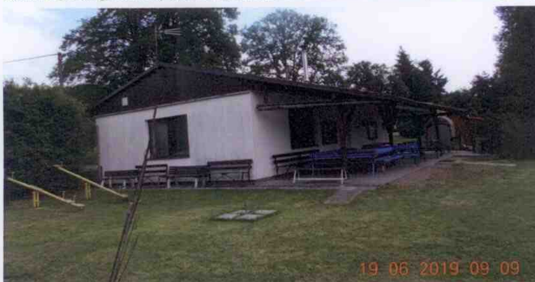
Obrázek 13: Fotografie šatny a klubovny nohejbalového oddílu Pavlovsko (Obec Dobřív, 2019)

K nohejbalovému hřišti náleží i šatny s klubovnou nohejbalového oddílu Pavlovsko. Tento objekt je majetkem obce Dobřív a stejně jako hřiště nohejbalu je má v užívání Nohejbalový oddíl. Celý objekt se nachází na parcele č. 153. Areál nohejbalového hřiště a klubovny slouží jako zázemí k veškerému společenskému a kulturnímu dění na Pavlovsku.