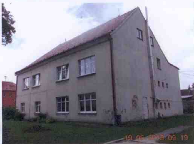
Obrázek 14: Fotografie Základní školy Dobřív (Obec Dobřív, 2019)

Obec Dobřív disponuje také základní školou s prvním stupněm (od 1. do 5. třídy) na parcele č. 26. Dobřívští žáci mají k dispozici malou tělocvičnu přímo v budově školy (v přízemí, na obrázku 13 dvě dolní okna vpravo). Tato tělocvična je malá, ale pro využití žáků je dostačující.