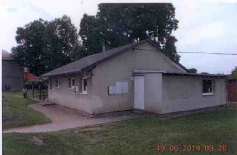
Obrázek 8: Fotografie kabiny národní házené (Obec Dobřív, 2019)

K hřišti národní házené patří také kabiny národní házené, které jsou taktéž majetkem TJ Sokol Dobřív a nachází se na parcele č. 553. Kabiny slouží hráčům házené mimo jiné k převlékání, hygienickým potřebám a strategickým poradám týmu. V posledních letech prošly rekonstrukcí podporovanou z dotací Plzeňského kraje a Obecního úřadu Dobřív. U kabin bylo nově vybudováno sezení, které hráči využívají k socializaci a zábavě po tréninku.