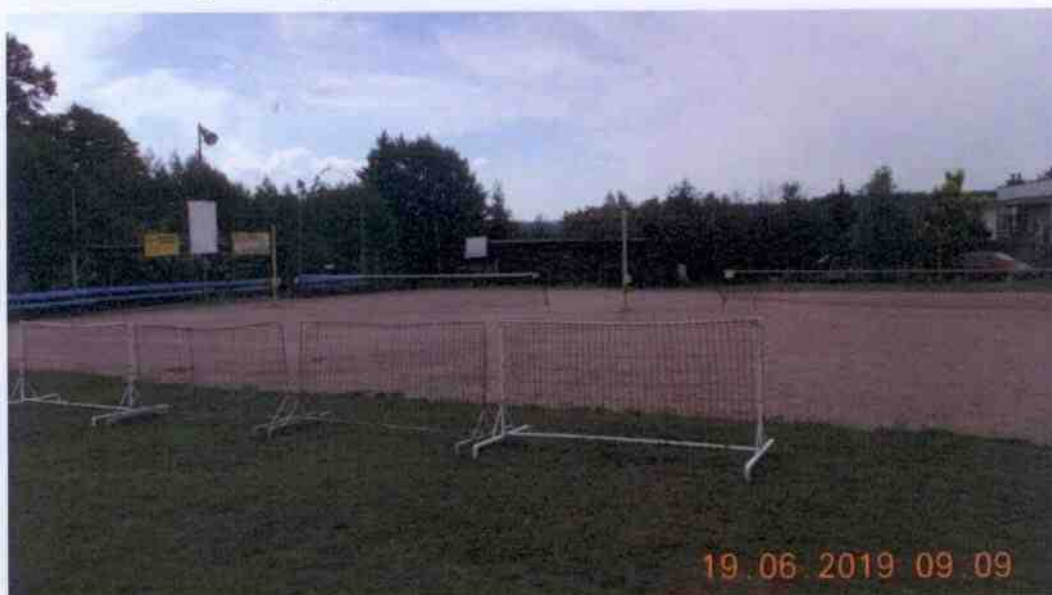
Obrázek 12: Fotografie nohejbalového hřiště Pavlovsko (Obec Dobřív, 2019)

Nohejbalové hřiště Pavlovsko je majetkem obce Dobřív a nachází se na pozemku p. č. 6 na území Pavlovska. Objekt má v užívání Nohejbalový oddíl Pavlovsko z. s. Nohejbalové hřiště bylo vybudováno v roce 1995 a do dnešní doby slouží k zajímavým sportovním aktivitám.