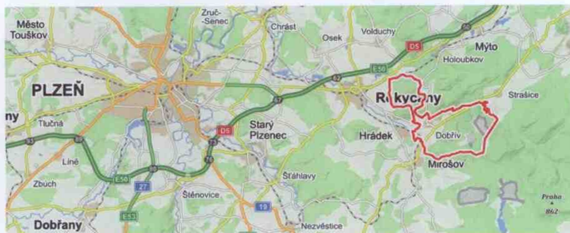
Obrázek 1: Poloha obce Dobřív vůči městům Rokycany a Plzeň (mapy.cz, 2019)

V blízkém okolí Dobříva a Pavlovska se nachází přírodní rezervace Žďár, která je chráněným územím především z důvodu zachování lišejníkové flóry a přirozených porostů na skalnatém kopci se suťovými porosty bučinného charakteru. Na území Žďáru se nachází hluboké smíšené lesy, díky kterým je území Dobříva a Pavlovska oblíbenou lokalitou pro návštěvníky. Nové katastrální území Dobřív v Brdech nabízí rozsáhlý lesní masiv a zachovalou přírodu, které jsou vyhledávány zejména cykloturisty. Na obrázku 1 lze vidět polohu obce Dobřív vůči okresnímu a krajskému městu, na obrázcích 2 a 3 jsou potom zobrazeny obec Dobřív a Pavlovsko. Po obrázcích následuje tabulka 1, která má za cíl uvést souhrnné informace o obci Dobřív, ať už se jedná o rozlohu, počet obyvatel, kódy NUTS nebo status.