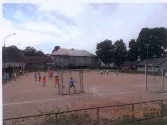
Obrázek 7: Fotografie hřiště národní házené (Obec Dobřív, 2019)

V obci se nachází také hřiště národní házené. Leží na parcele č. 88 a náleží majetku TJ Sokol Dobřív. Jak již z názvu vyplývá, používá se hřiště především pro tréninky házené. K hřišti přísluší kabiny házené. Národní házená v Dobřívě v roce 2018 oslavila 100 let svého vzniku.