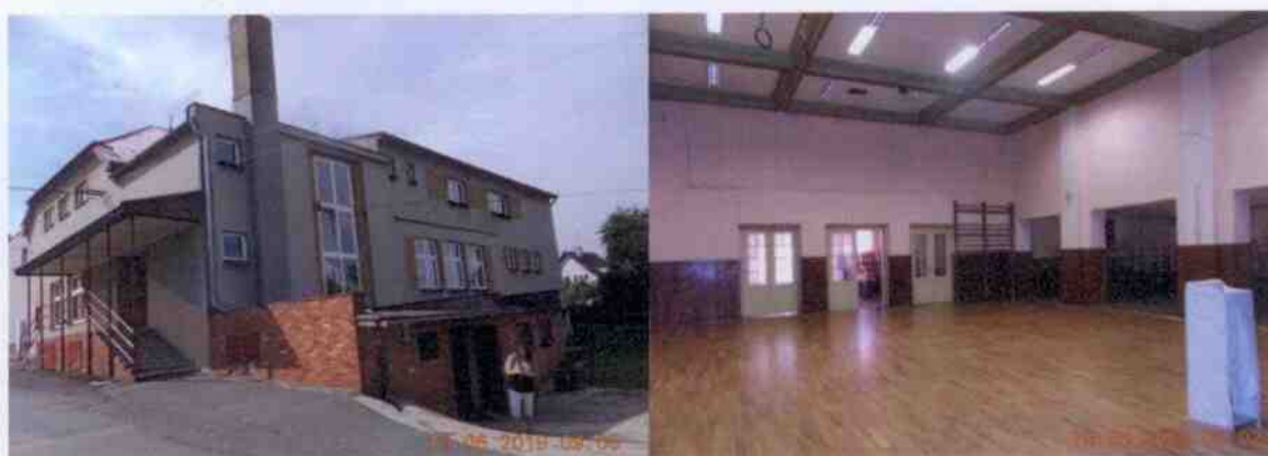
Obrázek 6: Fotografie Sokolovny Dobřív zvenku a zevnitř (Obec Dobřív, 2019)

V obci se dále nachází Sokolovna Dobřív, která je též ve správě Tělocvičné jednoty Sokol Dobřív. Sokolovna se nachází na pozemku č. 230, číslo popisné 200, vedle víceúčelového hřiště. V posledních letech byl objekt Sokolovny rekonstruován, byla provedena výměna okna a podlahy. Mimo pravidelná cvičení sportovních oddílů TJ Sokol Dobřív se v místní tělocvičně odehrávají i různá sportovní soustředění, ale také kulturní společenské akce jako každoroční plesy. Tělocvična v Sokolovně je k dispozici i mateřské a základní škole Dobřív pro pořádání Mikulášských besídek nebo maškarních bálů.