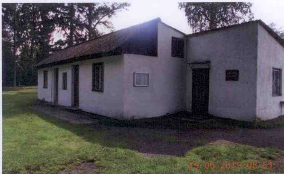
Obrázek 11: Fotografie kabin oddílu kopané (Obec Dobřív, 2019)

K fotbalovému hřišti přísluší také kabiny oddílu kopané na parcele č. 625 hned vedle hřiště. Tyto kabiny jsou v majetku TJ Sokol Dobřív a jsou ve velmi špatném technickém stavu, navíc bez sociálního zařízení. Obec plánuje provést výstavbu nových kabin do roku 2023.