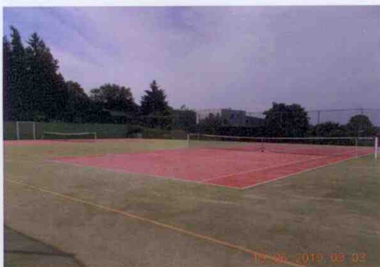
Obrázek 5: Fotografie víceúčelového hřiště s umělým povrchem (Obec Dobřív, 2019)

Víceúčelové hřiště bylo vystavěno v letech 2004 a 2005 a nachází se na pozemku p. č. 1207/3 u Sokolovny a nese v názvu jméno Josefa Laibla. Toto hřiště je v majetku Tělocvičné jednoty Sokol Dobřív, která se o objekt stará a udržuje ho. Díky svému umělému povrchu je vhodné pro míčové hry všech druhů, zejména pro volejbal, tenis, házenou, streetball nebo fotbal. Sportoviště je otevřené pro veřejnost od začátku dubna do konce října, v případě příznivého počasí je otevírací doba dle potřeby prodloužena.