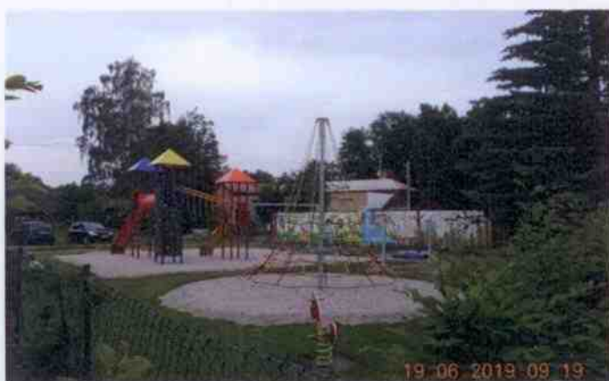
Obrázek 9: Fotografie dětského hřiště (Obec Dobřív, 2019)

Nejnovějším sportovním zařízením v Dobřívě je dětské hřiště. To bylo vystavěno v roce 2018 na parcele č. 95/2. Majitelem objektu je obec Dobřív. Hřiště je využíváno především rodiči s dětmi, kteří zde najdou zábavu v prolézačkách, skluzavkách, horolezeckých stěnách a dalších různých atrakcích. Hřiště se nachází vedle budovy základní školy, takže přechod dětí na hřiště je rychlý a bezpečný. Hřiště je otevřeno celoročně.