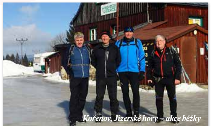
Kořenov, Jizerské hory – akce běžky