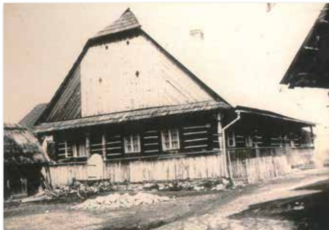
Statek č. p. 5 „U Vondrů“