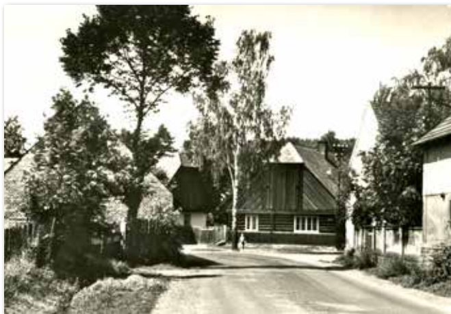
Statek č. p. 2 „U Vlků“