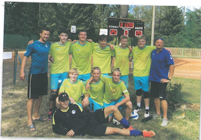
Družstvo dorostu A vstoupilo do sezóny vítězně na hřišti v Záluží.