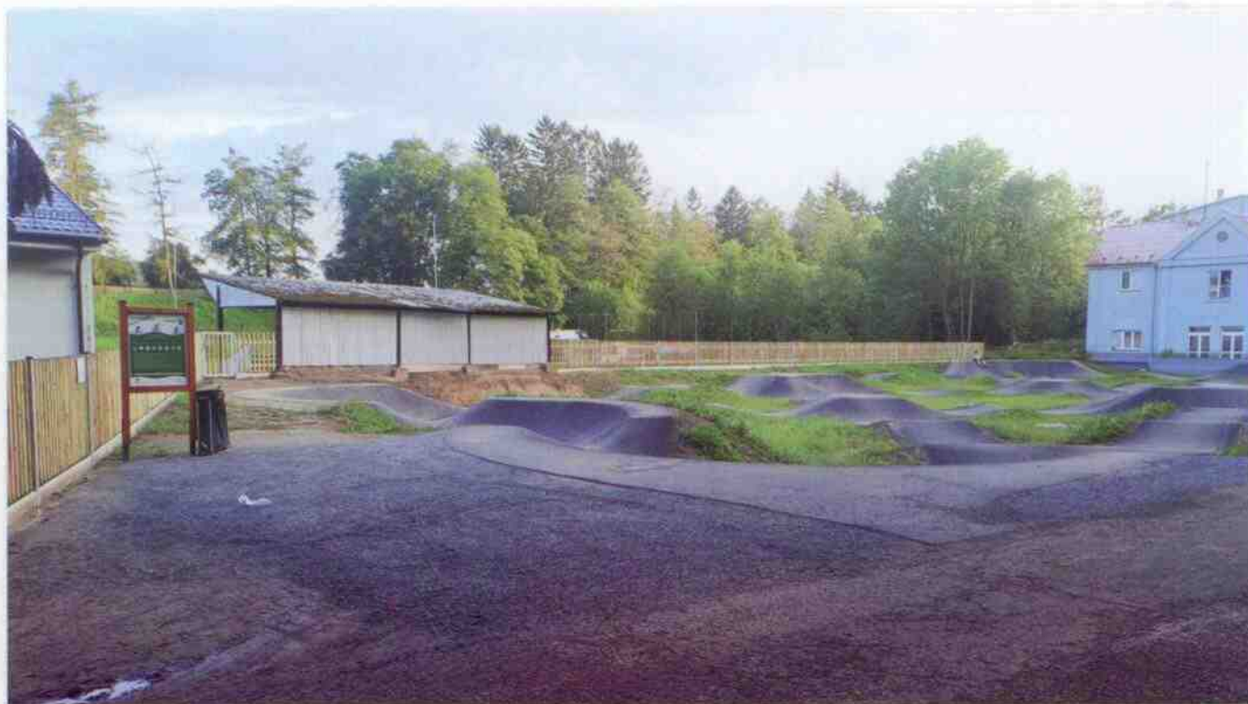
Pumptracková dráha u nás v Dobřívě