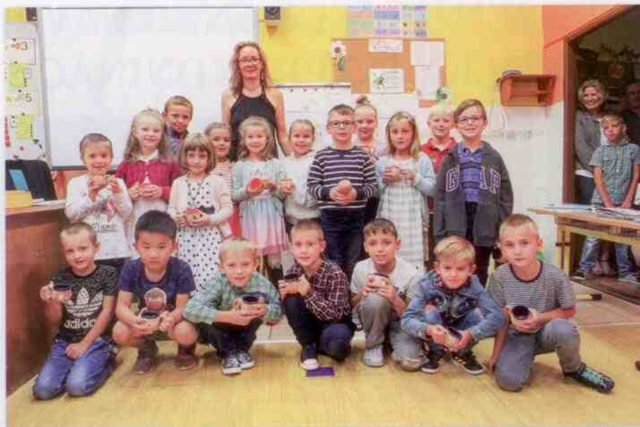
1. a 2. třída