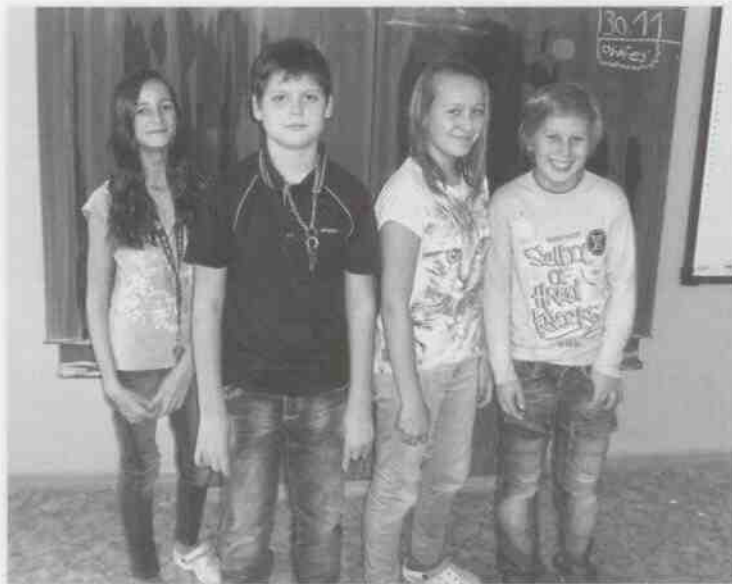
Žáci 6. B z Dobřiva (zleva):

Co se ti nejvíce líbí na strašické škole?