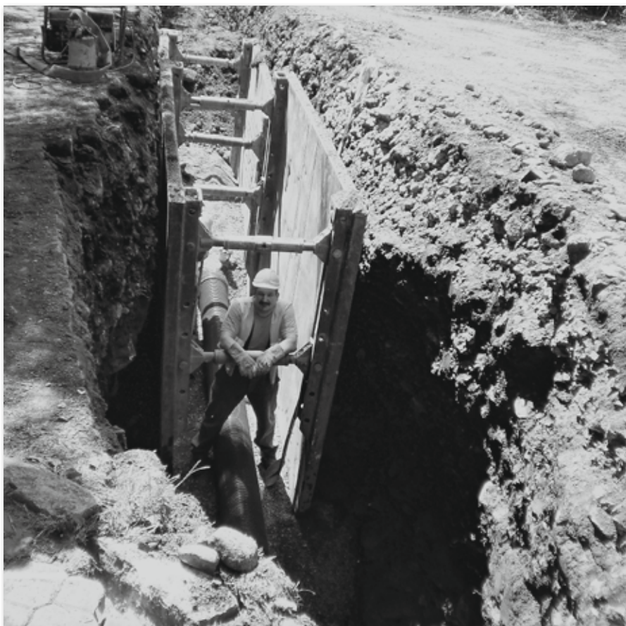
Ve výkopu stojí dělník vysoký téměř 2 m