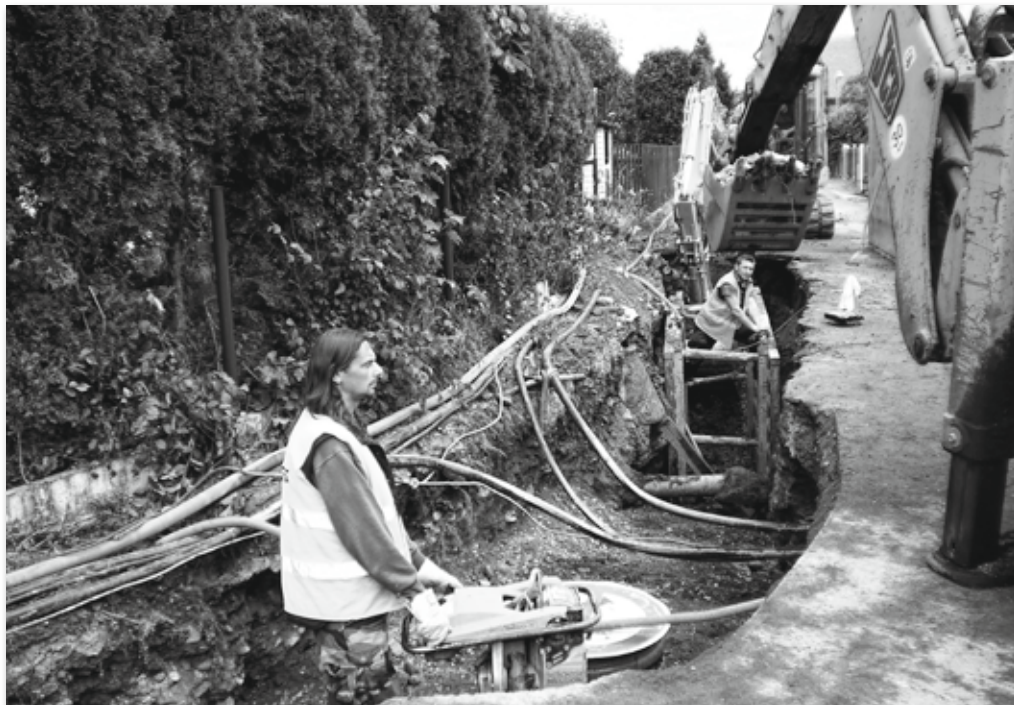
Pokládka kanalizace v prostoru návsi. O hloubkovém uložení kanálu vypovídají vrstvy původního terénu patrné na boku výkopu.

Výstavba kanalizace v obci Dobřív probíhá dle schváleného harmonogramu. Výstavba probíhá současně na třech místech obce. V části nábřeží od čerpací stanice podél Padrského potoka musel být na třech místech současně předěláván původní 84 let starý obecní vodovod. Větší komplikace tvoří přechody starých kanalizací přes trasu nového kanálu. V úzkých uličkách, kde jsou uloženy v komunikaci elektrické kabely, vodovod, plynové vedení a původní dešťová kanalizace postupují práce pomaleji. V komunikaci na Strašice se kromě jmenovaných sítí nachází 100 let starý vodovodní řad na Rokycany a telefonní kabely. Práce musí být prováděny za plného silničního provozu. Vážnější komplikace budou tvořit oba přechody přes Padrský potok a podchod pod původním silničním můstkem u Zoulů. Původní představa, že přechody přes potok se provedou v měsíci srpnu nešla realizovat z důvodu většího průtoku vody v tomto období.